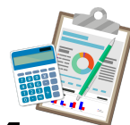
Gráfico | 2022 | 2023 | 2024